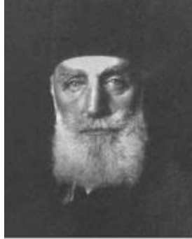
عبد المجيد الثاني 1922 1924 م

Khalifah Abdul Majid Effendi (Khalifah Tahun 1922-1924)